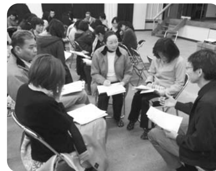
◀価値観交流のためのグループワーク

社協ではこうした職員研修を通じて基礎能力の向上に努めていきたいと思ひます。大変充実した研修会となりました。