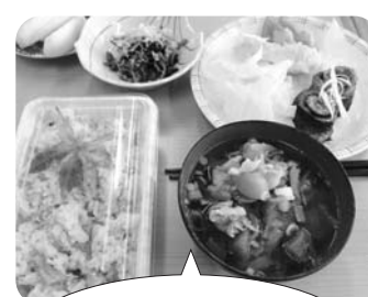
会員さんが持ってきてくれたもみじを飾って彩りもきれいにできました♪

人生を楽しむには健康が何よりも大切です。そのために皆さんが「食べたいものを美味しく食べる」ことをいつまでも楽しんでいけるよう、これからも充実した料理教室にしていきたいと思ひます。